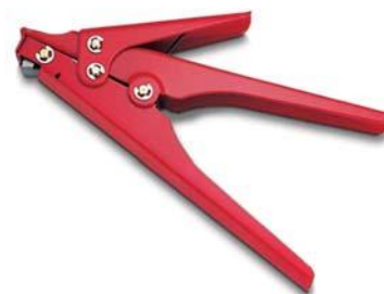
Зажимные ножницы НЗХ